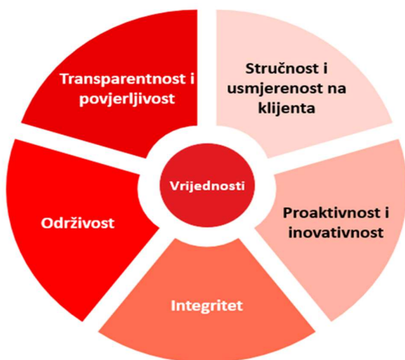
Slika 1. Vrijednosti u koje HBOR vjeruje i koje ugrađuje u svoje poslovanje

Vrijednosti su pokretačka snaga HBOR-ove organizacijske kulture i osiguravaju uspješnu provedbu Strategije. Vrijednosti opisuju HBOR-ov način rada i ponašanja prema klijentima, partnerima i drugim dionicima, kao i jednih prema drugima u HBOR-u.